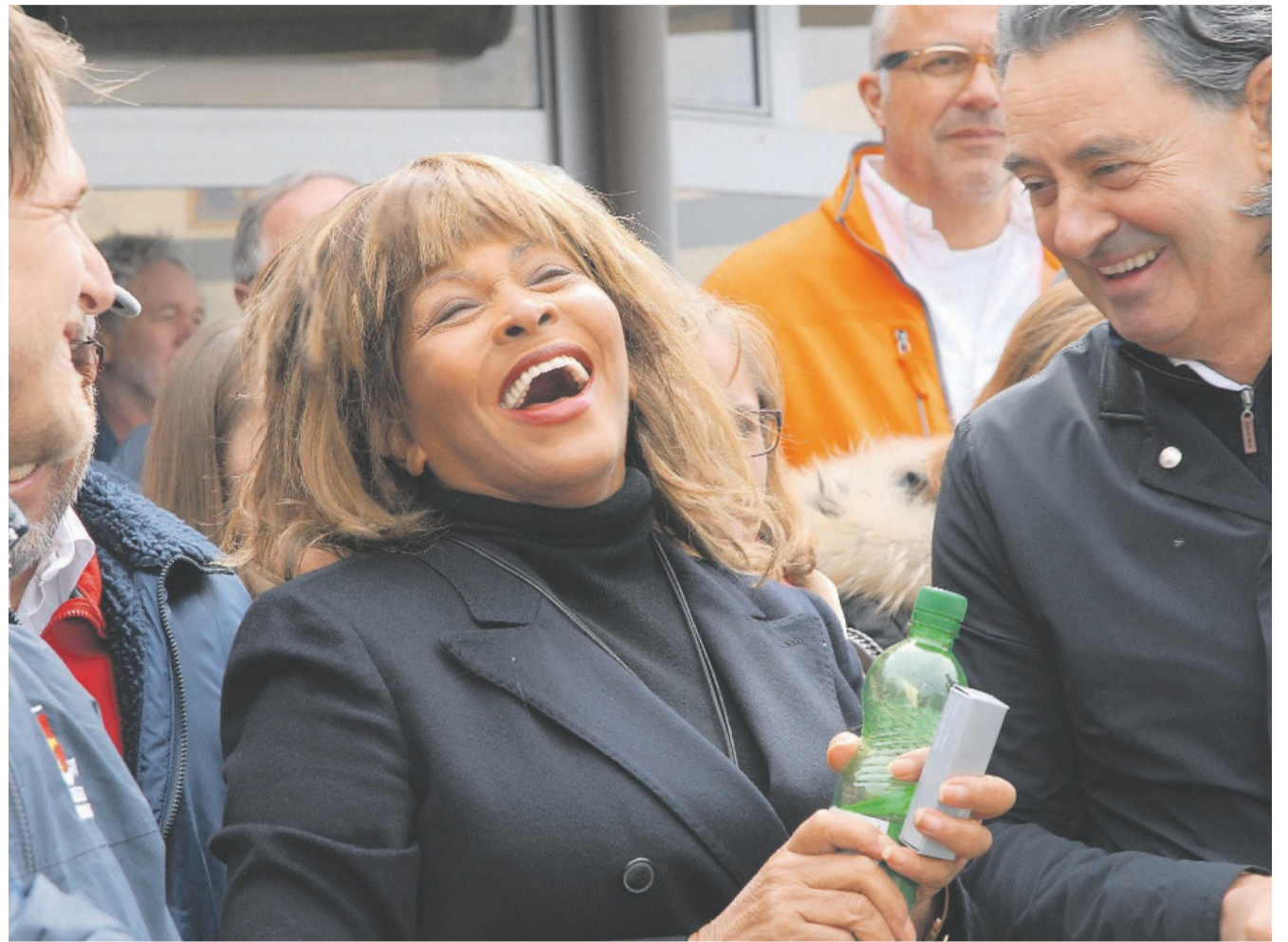
Beste Stimmung am 6. April 2013 bei der Taufgotte Tina Turner und ihrem Partner Erwin Bach (rechts) bei der Taufe des Bootes «Tina».

Und Küsnachts Pfarrer erinnert sich in seinem Kommentar (siehe links) an den Weltstar, eine bekennende Buddhistin, auf seine Weise. Man könnte sagen: über alle Religionen hinweg.