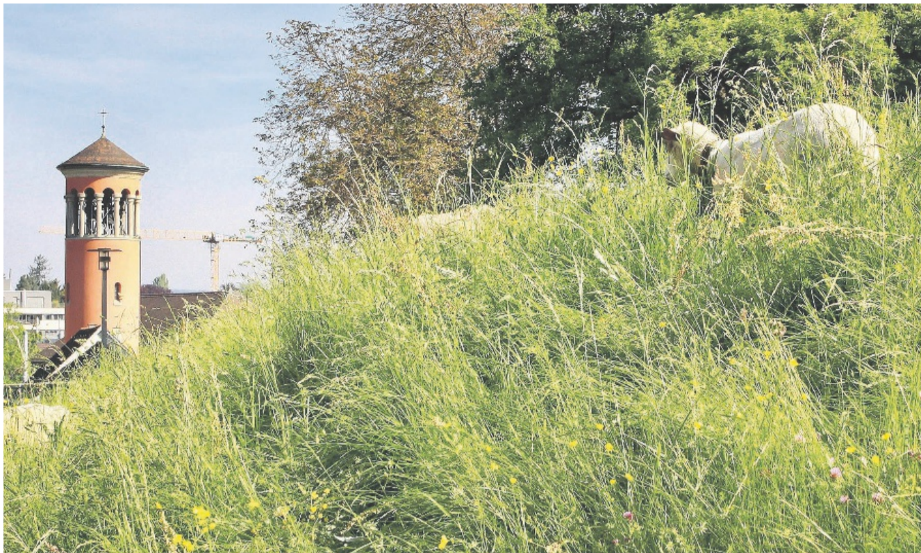
Im Kanton Zürich leben 360 000 Katholikinnen und Katholiken, die wir hier auf keinen Fall «Schäfchen» nennen wollen.

Ab sofort stehen 50 kostenlose Abstellplätze mit vier Abstellplätzen für Cargovelos bereit. Die Flächen für die Velos befinden sich im Eingangsbereich des Parkhauses, hin zu den Gleisen des Bahnhofs. Parkfelder wurden für den Versuch keine aufgehoben. Der Versuch läuft bis im Mai 2025. Die Nutzungszahlen werden vor der Fertigstellung der Velostation im «Haus zum Falken» evaluiert. (pd./toh.)