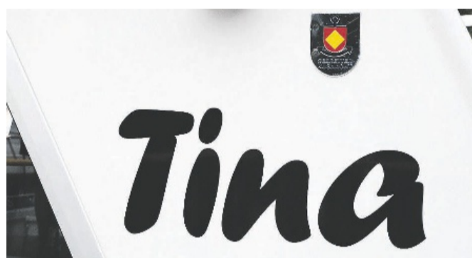
«Tina» auf dem Einsatzboot des Seerettungsdienstes Küsnacht-Erlenbach.