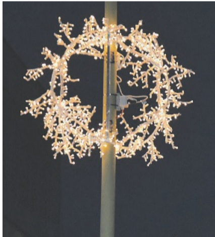
«Golden Twigs»: 80 geflochtene Kränze.

leuchtung an der Seestrasse erstrahlen lassen.