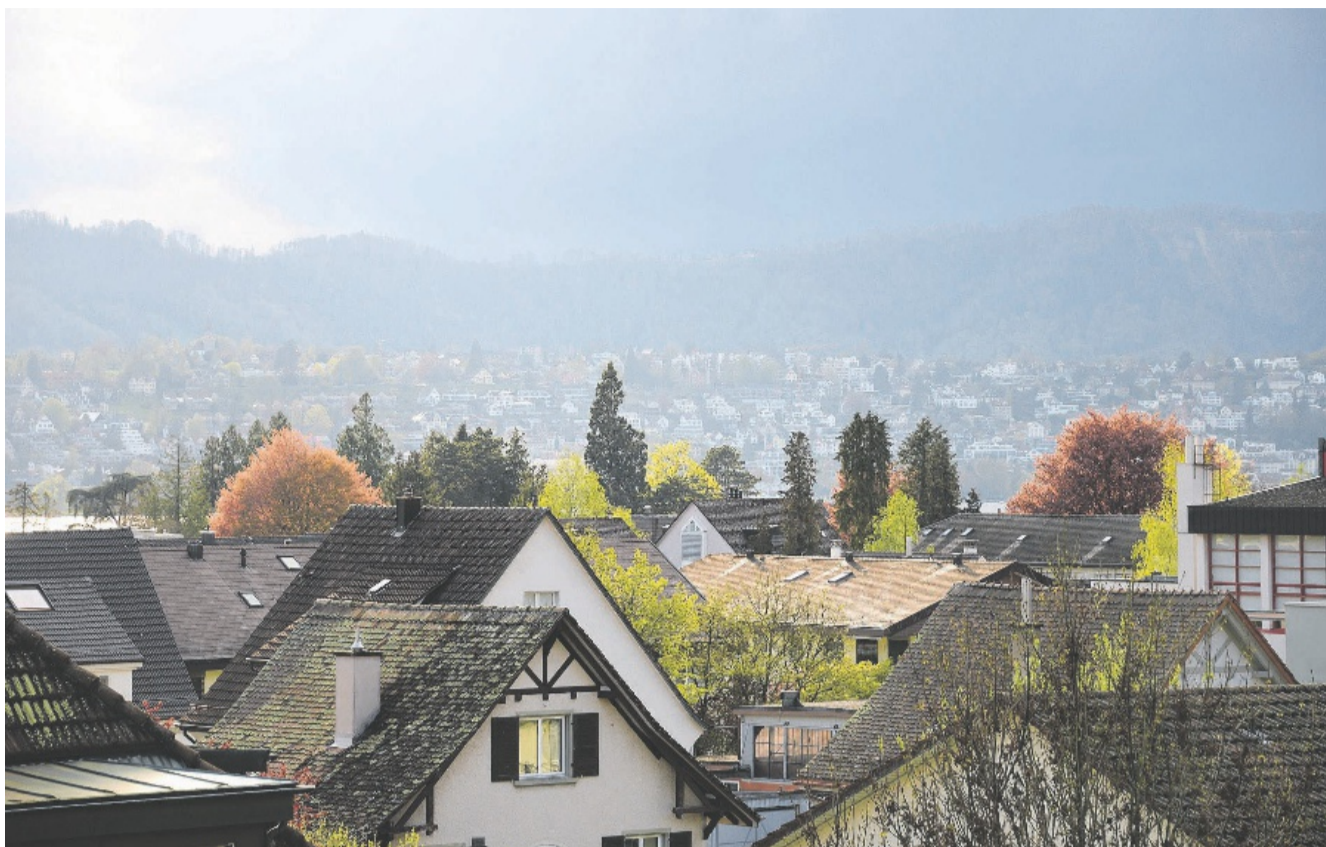
Welche Altersversorgung ist die richtige? Die Abstimmung vom 18. Juni beschäftigt Küssnacht (im Bild: Heselbachquartier).

Ein weiterer Strang im Narrativ besagt, dass das Alters- und Gesundheitswesen von der Grösse her mit einem mittleren KMU vergleichbar sei, also seien Strukturen, die der Wirtschaft entlehnt sind, naheliegend. Ist das so? Im Jahr 2017 wurde die Auslagerung des Kantonsspitals Winterthur in eine AG vom Volk