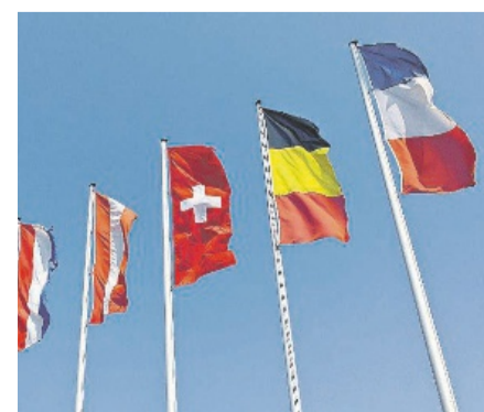
Podium: Neutralität um jeden Preis?

An der Podiumsdiskussion «Neutralität um jeden Preis?» setzen sich Experten wie der ehemalige Schweizer Botschafter und Direktor der DEZA, Martin Dahinden, mit den Herausforderungen