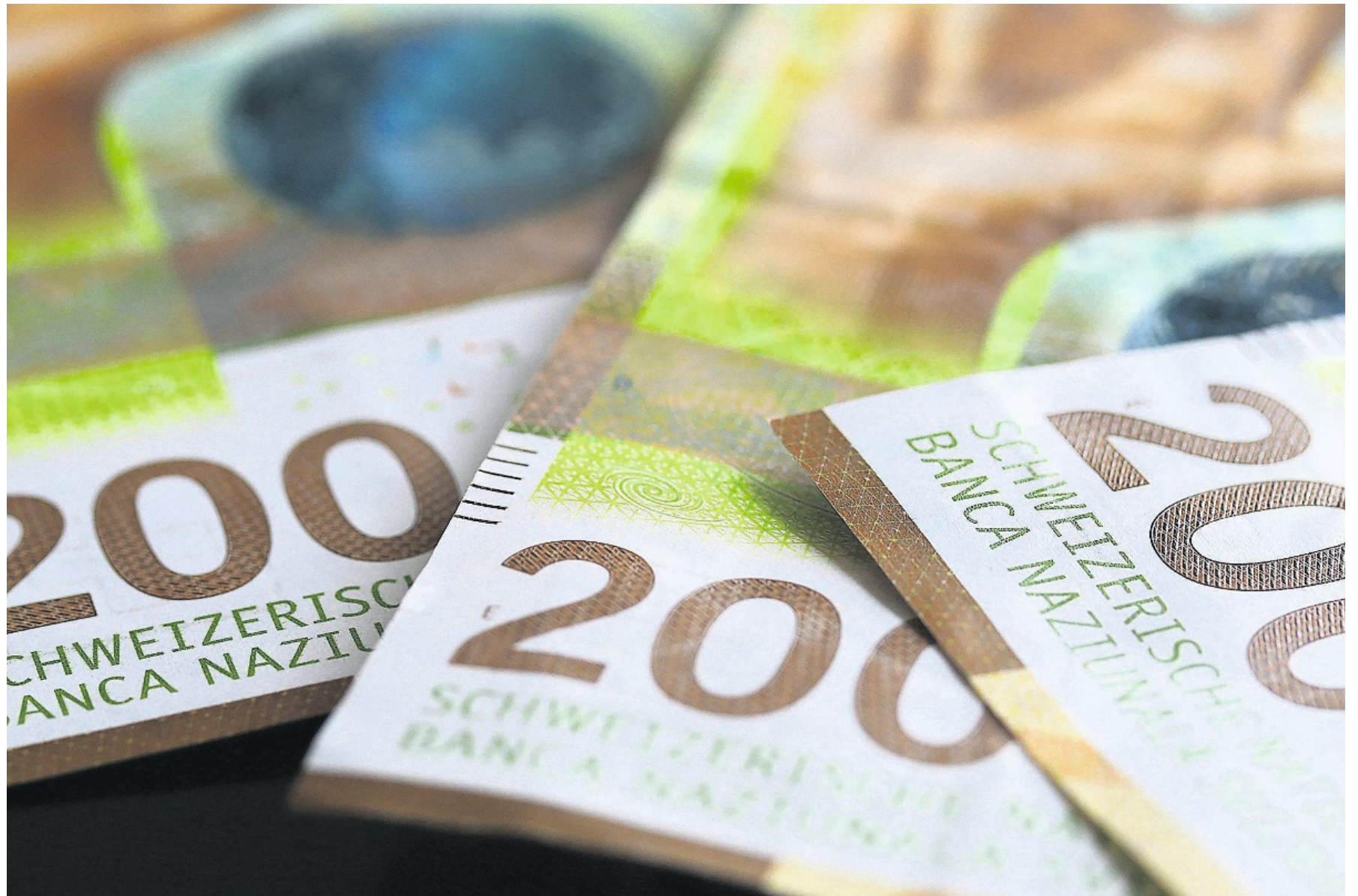
Ganz und gar keine Geldsorgen: Herrliberg verfügt im Vergleich zu anderen Zürcher Gemeinden über ein sehr hohes Nettovermögen.

Der Ertrag 2023 der Gemeinde Herrliberg betrug 111,38 Millionen Franken, der Aufwand 104,77 Millionen Franken. Die Gemeinde hatte mit einem Gewinn von 4,65 Millionen Franken gerechnet. Die Abweichung von plus 2 Millionen Franken zum budgetierten Gewinn sei vergleichsweise gering. «Wir haben gut budgetiert», betonte Gieringer. Ein Grund für den hohen Ertrag seien die wichtigen Grundstückgewinnsteuern mit sehr hohen 15,2 Millionen Franken. In den letzten zwei Jahren lag der Ertrag aus Grundstückgewinnsteuern deutlich höher als in den Jahren zuvor. «Die 4,7 Millionen Franken höheren Erträge bei den allgemeinen Gemeindesteuern flossen zu einem grossen Teil über den höheren Beitrag an den Finanzausgleich wieder ab», so Gieringer. Auf die Grundstückgewinn-