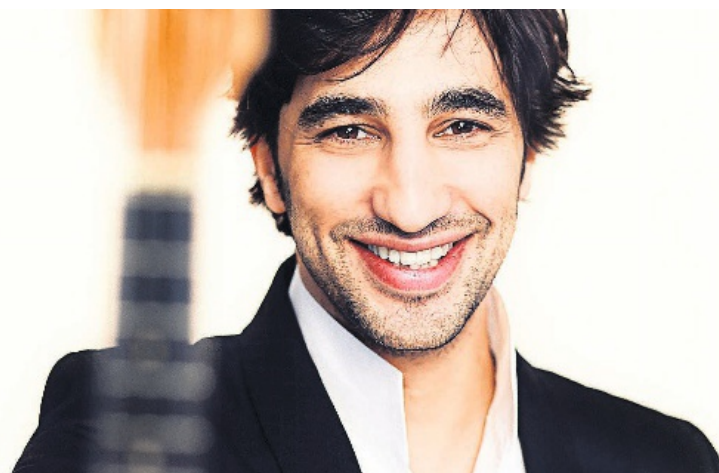
Mandolinist Avi Avital kehrt zurück auf die Bühne des Klassikfestivals Küsnacht.

Das Klassikfestival Küsnacht wird von Astrid und Sonja Leutwyler künstlerisch kuratiert und durch seinen gemeinnützigen Verein, aber auch durch Sponsoren und Stiftungen und vor allem Gönner getragen. Wer Supporter des Festivals werden möchte, meldet sich auf info@klassikfestival.ch . (e.)