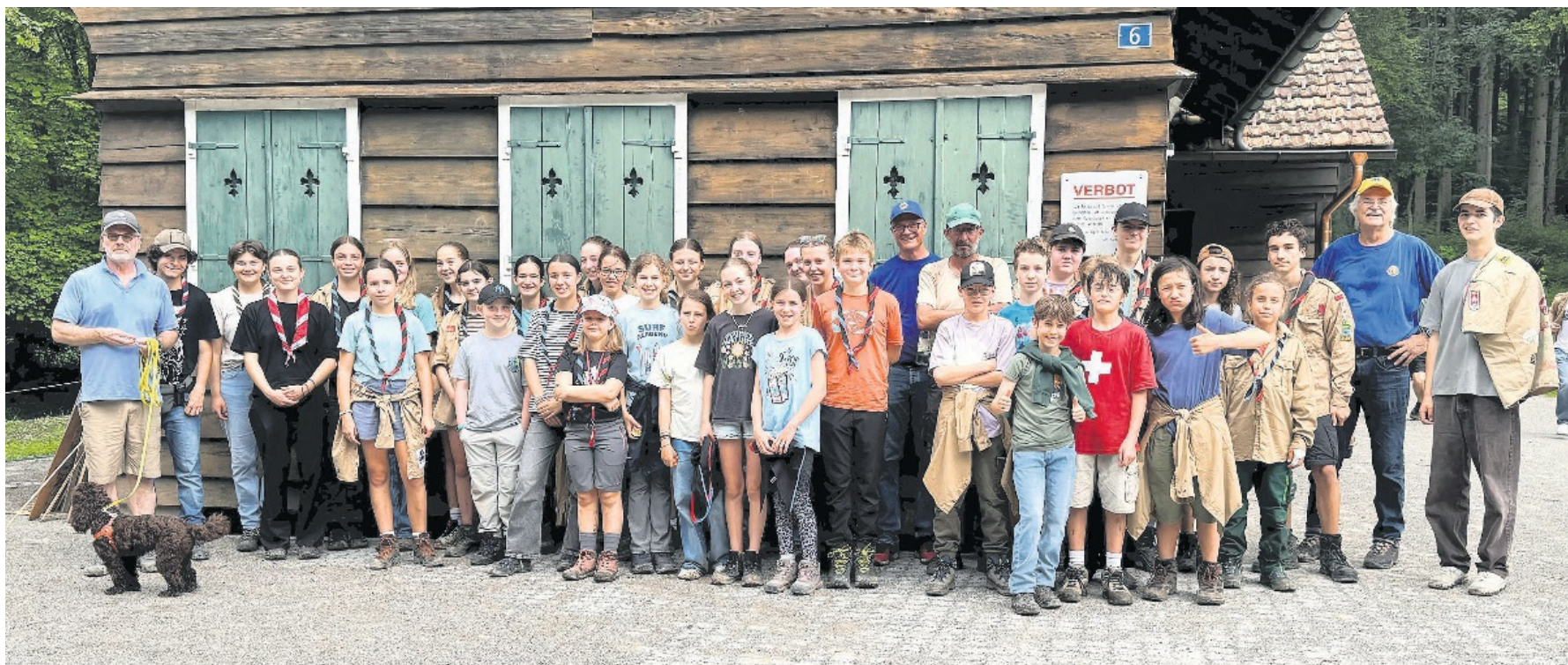
Gemeinsame Sache: Drei Generationen zwischen 10 und 70 Jahren machten sich auf die Suche nach invasiven Neophyten und lernten Bekämpfungsmöglichkeiten kennen.