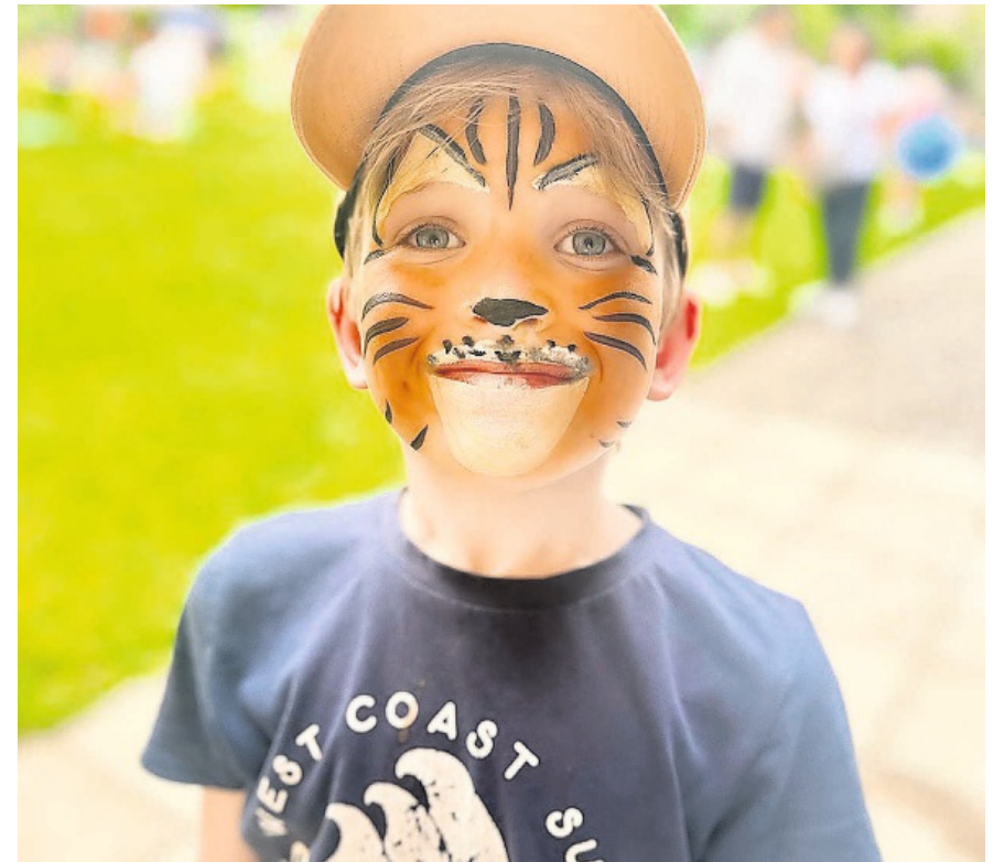
Spass darf sein: Für einen Tag lang einen Tiger spielen. Kinder lieben es, sich zu schminken.