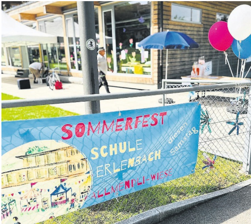
Bereits zum zweiten Mal hat der Elternrat ein Sommerfest organisiert – Fortsetzung folgt.