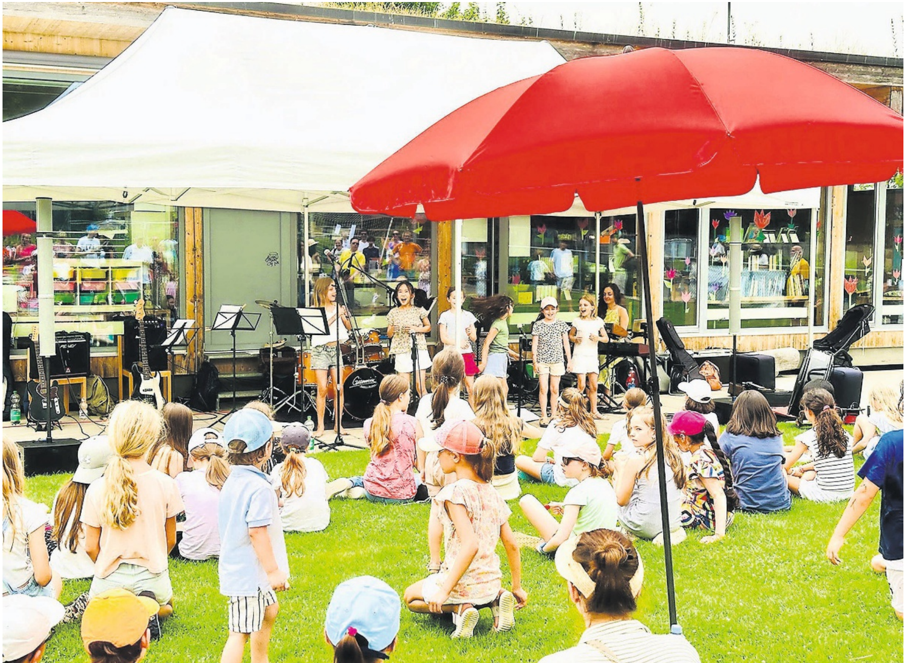
«I Love Rock'n'Roll» und andere Songs: Die Schüler-Lehrer-Band zeigte ihr Können und machte Stimmung am Fest. Bei den meisten Hits konnte jede und jeder lautstark mitsingen.