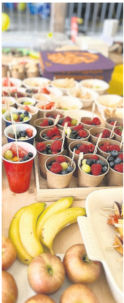
Eine kühlende Verstärkung nach dem Plausch.