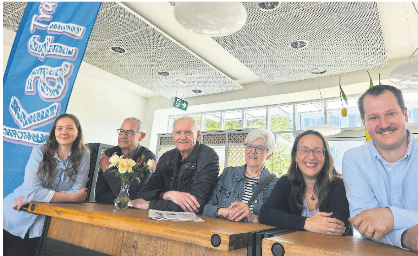
Sie eröffnen das Kafi Träff in Erlenbach, um die Gemeinschaft in der Gemeinde zu stärken.

Tag der offenen Tür Kafi Träff: Donnerstag, 4. Juli, ab 13.30 Uhr, Kirchgemeindehaus, Schulhausstrasse 40, Erlenbach. Reguläre Öffnungszeiten: Montag–Freitag, 8.30 bis 17 Uhr, vorerst bedient; Mittwoch, 8.30 bis 11.30 Uhr sowie 14 bis 17 Uhr; Freitag, 8.30 bis 11.30 Uhr