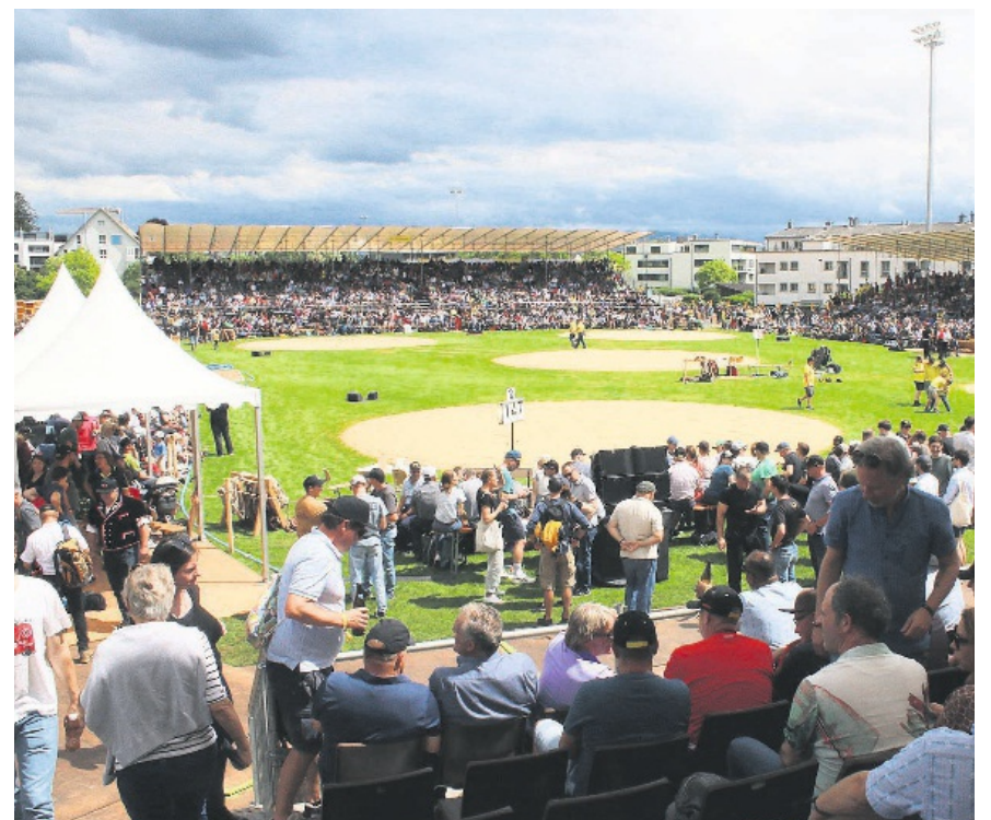
Fünf Plätze standen den Schwingern auf der Meilener Allmend zur Verfügung.

Nein, ich habe so viele Jahre lang Ehrenämter übernommen. Jetzt ist gut.