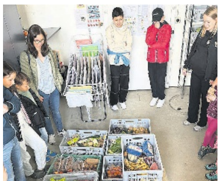
Ein Blick in den Menüplan der Zootiere.